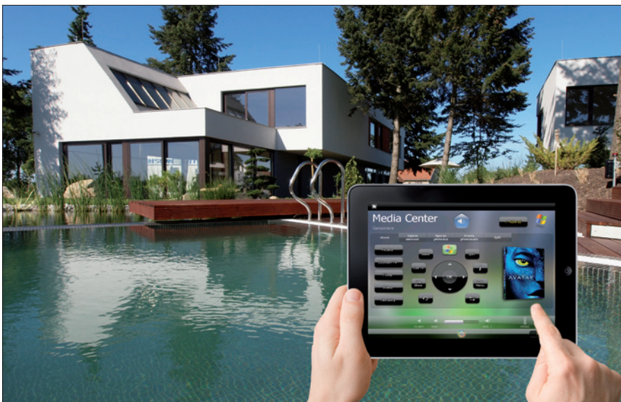
Obr. 1. Inteligentní dům, ovládaný z dotykového panelu

Ze zkušenosti vyplývá, že typickým klientem pro chytré bydlení je rodina, která již má zkušenost s bydlením v běžném domě