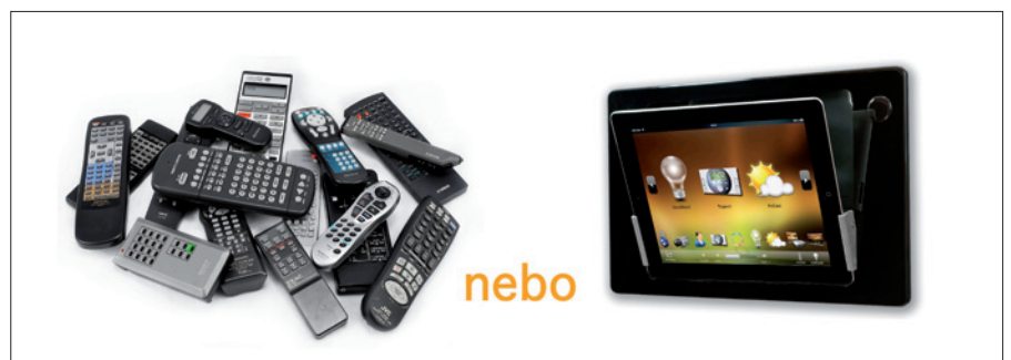
Obr. 2. Jediný přístroj typu iPad je univerzální a nahradí specializované ovládače pro různá zařízení

Toto řešení odstraňuje chaos vzniklý spoustou různých ovladačů, zlepšuje životní styl rodiny, bezpečnost i pohodlí (obr. 2). Například před odchodem z domu stačí jediný stisk tlačítka a inteligentní domácnost zhasne světla, aktivuje bezpečnostní systém, vypne televizi a veškeré další audiovizuální vybavení, odpojí rizikové spotřebiče (varná konvice, žehlička, kulma...) a zatáhne žaluzie. Navíc spojení inteligentní domácnosti s dalšími podsystémy, jako