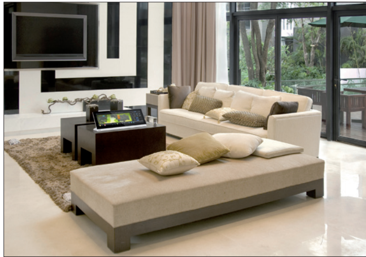
Obr. 3. Pohled na vybavení pokoje v inteligentním domě

připravit na realizaci chytré domácnosti, kterou lze provést hned nebo kdykoli v budoucnosti. Současně tak uživatel získá jistotu, že jeho nemovitost bude připravena na nejno-